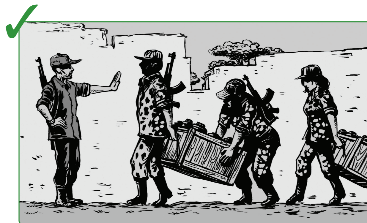
5 မည်သည့် သင့် ဖခင်များကို ခြိမ်းခြောက်ခြင်း လူသတ်မှုများကို ရွှေ့ပြောင်း သယ်ဆောင်ခြင်း သို့မဟုတ် သင့် ဖခင်များအတွင်း လူသတ်မှုများကို အသုံးပြုခြင်းတို့မှ ကာကွယ်တားဆီးရန် အတတ်နိုင်ဆုံးလုပ်ဆောင်ပါ။