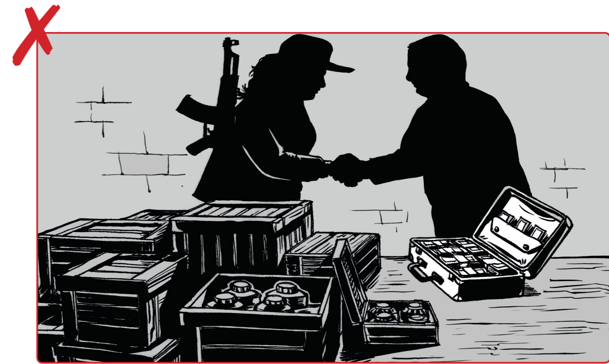
3 မဟာမိတ် အဖွဲ့များနှင့် ပင်လျှင် လူသတ်မှုများကို ယူဆောင်ခြင်း၊ လက်ခံခြင်း၊ ဝယ်ယူခြင်း၊ ပေးကမ်းခြင်း၊ ကုန်သွယ်ခြင်း သို့မဟုတ် ရောင်းချခြင်း မည်သည့်အမျိုးမျိုး မပြုပါနှင့်