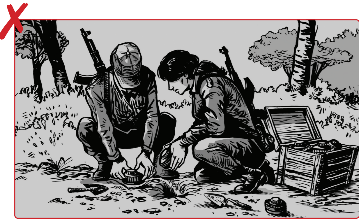
1 မည်သည့် အခြေအနေများတွင်မဆို မိုင်းဆီမည်သို့က လေ့လာဖွင့် ပေါက်ကွဲစေသော လူသတ်မှုများကို အသုံးမပြုပါနှင့်။