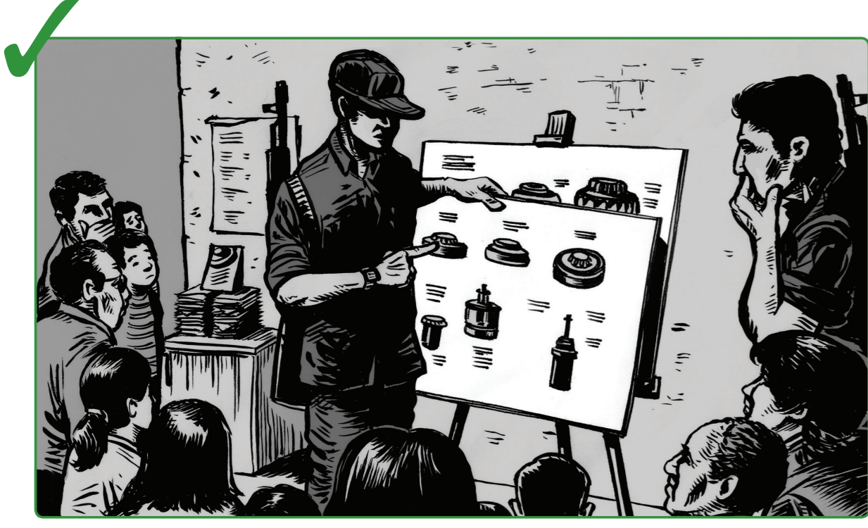
10 သင်နှင့် ထိတွေ့ဆက်ဆံရသူများဖြစ်သည့် တိုက်ခိုက်ရေးသမားများနှင့် အရပ်သားများအား လူသတ်မှုများ လုံးဝ ပိတ်ပင်တားဆီးရေးကို ဖြည့်တင်ပြီး ရှင်းလင်းပြောပြပါ။