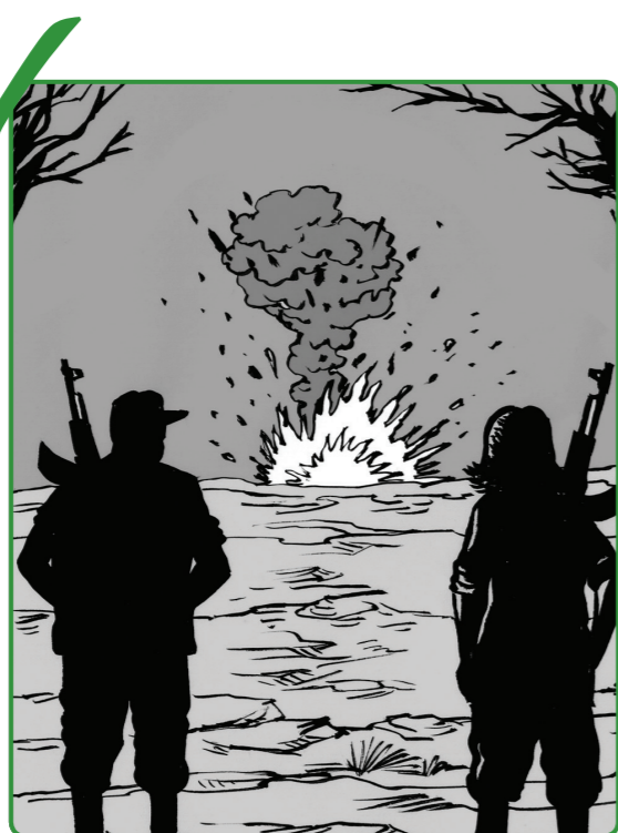
4 လူသတ်မှုများကို စုပုံသို့လောင်ခြင်း သို့မဟုတ် ထိန်းသိမ်းခြင်း မပြုပါနှင့်။ လူသတ်မှုများအားလုံးကို ဖျက်ဆီးပစ်ရမည်။