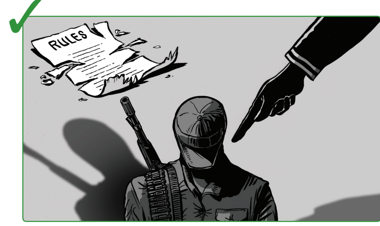
12 နိုင်ငံတကာ စံချိန်စံညွှန်းများနှင့် အညီ အကြမ်းဖက်မှုများကို တားမြစ်ပိတ်ပင်ရမည်။