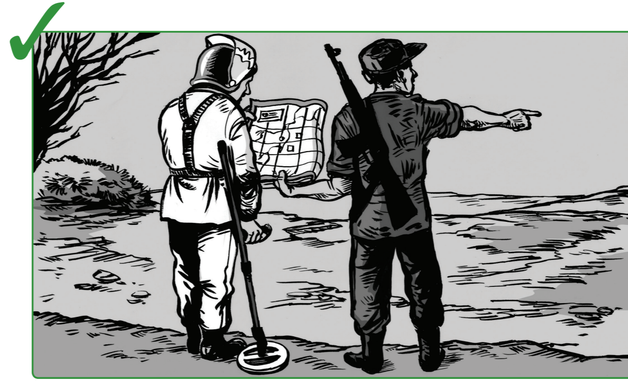
8 မိုင်းရှင်းလင်းရေး လုပ်ငန်းများတွင် တက်ကြွစွာ ပူးပေါင်းပါဝင်ပါ။