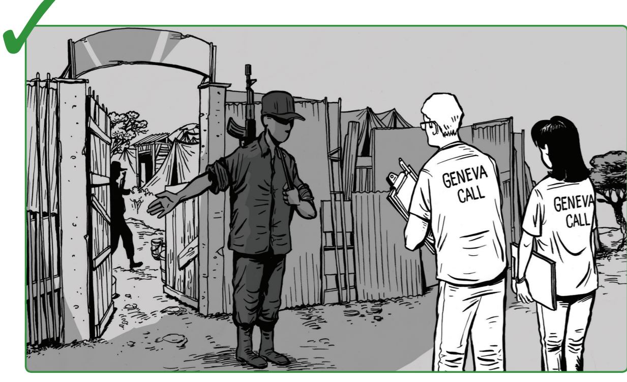
13 ဤစည်းမျဉ်းများအား ရှိသလောက်များစွာ တွေ့ကြုံသိစေရန် Geneva Call နှင့် ပူးပေါင်းဆောင်ရွက်ပါ။

Geneva Call Geneva Call သည် နိုင်ငံတကာ လူသားရေး စာနာထောက်ထားရေး စံနှုန်းများအား လိုက်နာစောင့်ထိန်းခြင်းနှင့် ရှိသလောက်များစွာ ဖြည့်တင်ရန်အတွက် အစိုးရ မဟုတ်သည့်လက်နက်ကိုင် အဖွဲ့အစည်းများနှင့် ဆွေးနွေးမှု ပြုလုပ်သည့် ကြားနေပြီး ဘက်မလိုက်သော အစိုးရ မဟုတ်သည့် အဖွဲ့အစည်း တစ်ရပ်ဖြစ်သည်။ Geneva Call သည် လက်နက်ကိုင် ဗဟိုဖွဲ့စည်းမှုအတွင်း အရပ်သားများအား ကာကွယ်ခြင်း အပေါ်တွင် ၎င်း၏ လုပ်ဆောင်မှုများကို အဓိကထားသည့် အထူးသဖြင့် • ကလေးများအား ကာကွယ်ခြင်း • လိင်မိုင်းဆိုင်ရာ အကြမ်းဖက်မှုအား ကာကွယ်တားဆီးခြင်းနှင့် လိင် အပေါ်တွင် အခြေခံ၍ ခွဲခြားဆက်ဆံမှုကို ပယ်ဖျက်အောင် ပြုလုပ်ခြင်း • လူသတ်မှုများကို ပိတ်ပင်တားဆီးခြင်း