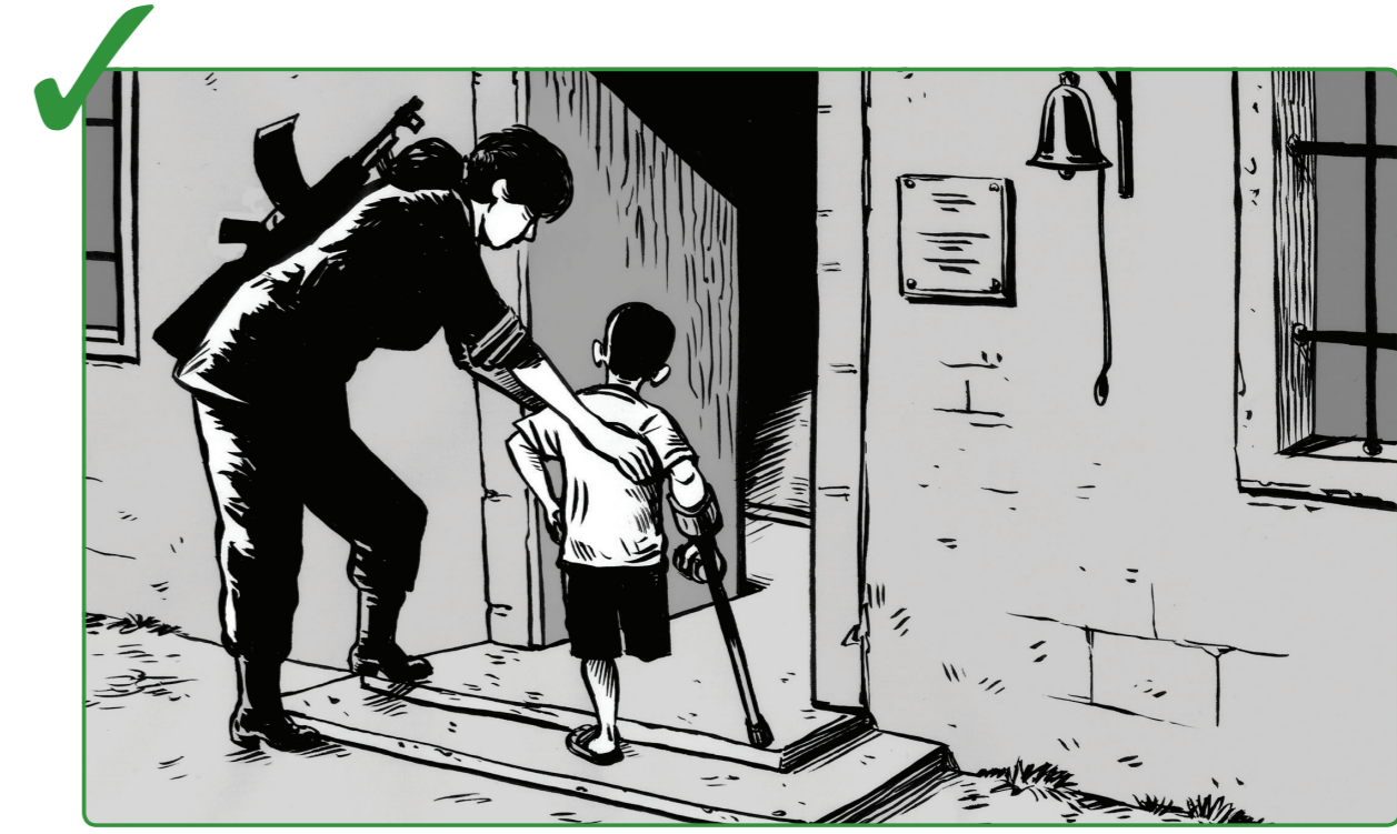
9 မိုင်းဆီတားဆီးသူများသည် လေးစားမှုနှင့် ကရုဏာတို့ ရတိုက်သည်ဟု သတိရလျက် ၎င်းတို့ကို အတတ်နိုင်ဆုံး ကူညီပါ။