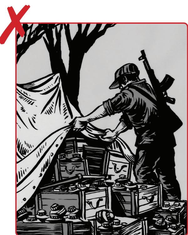
4 လူသတ်မှုများကို စုပုံသို့လောင်ခြင်း သို့မဟုတ် ထိန်းသိမ်းခြင်း မပြုပါနှင့်။ လူသတ်မှုများအားလုံးကို ဖျက်ဆီးပစ်ရမည်။