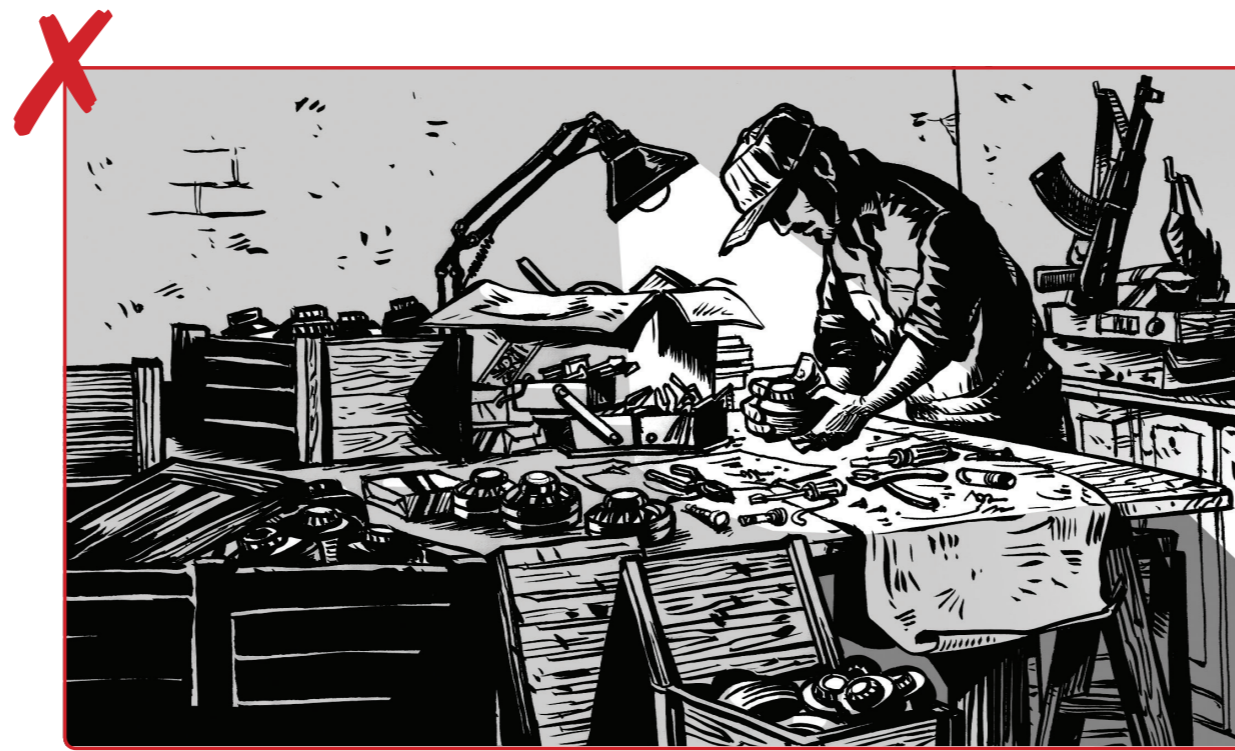
2 လူသတ်မှုများကို မပြုလုပ်ပါနှင့် သို့မဟုတ် မထုတ်လုပ်ပါနှင့်