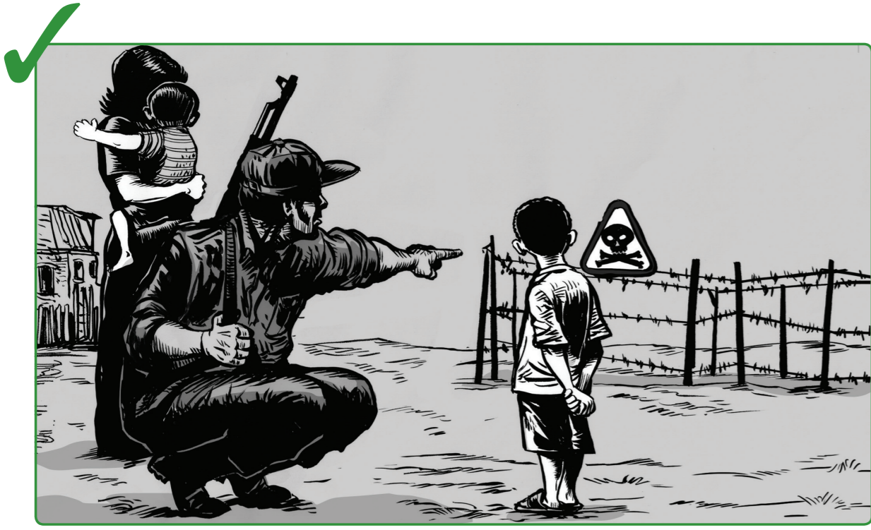
7 လူသတ်မှုများ၏ အန္တရာယ်ကို အရပ်သားများနှင့် ရင်ဆိုင်လူထုကို အထူးသဖြင့် ကလေးများအား မိုင်းဆီတားဆီးသည့် ဖခင်များကို ရှောင်ရှားရန် သတိပေးပါ။