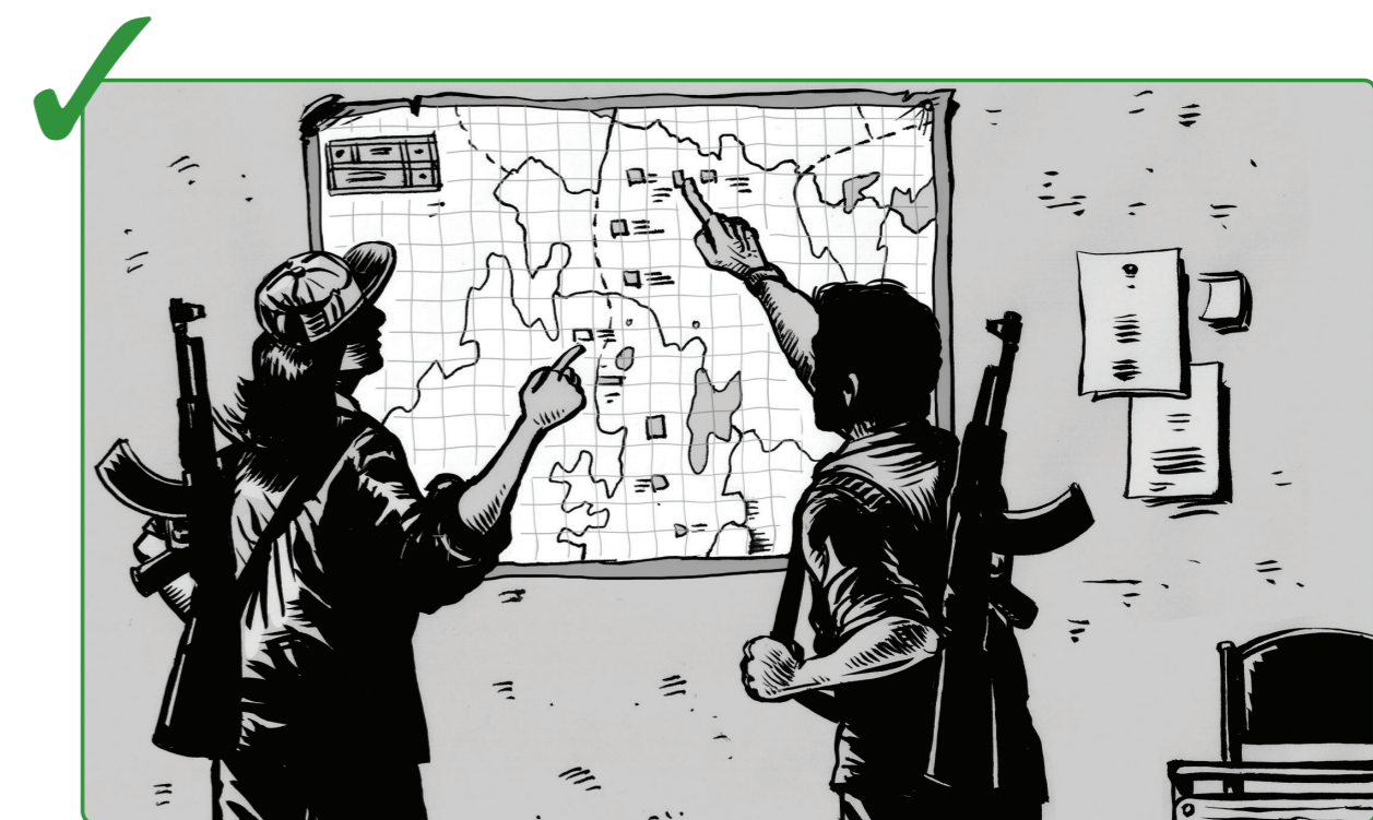
6 မိုင်းဆီတားဆီးသည့်ဟု သင် သိသော သို့မဟုတ် ယုံကြည်သော ဖခင်များကို မှတ်သားကာ မှတ်တမ်းတင်ပြီး သင့်အထက်အရာရှိထံသို့ သတင်းပို့ပါ။